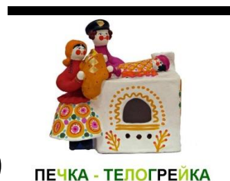
ПЕЧКА - ТЕПОГРЕЙКА